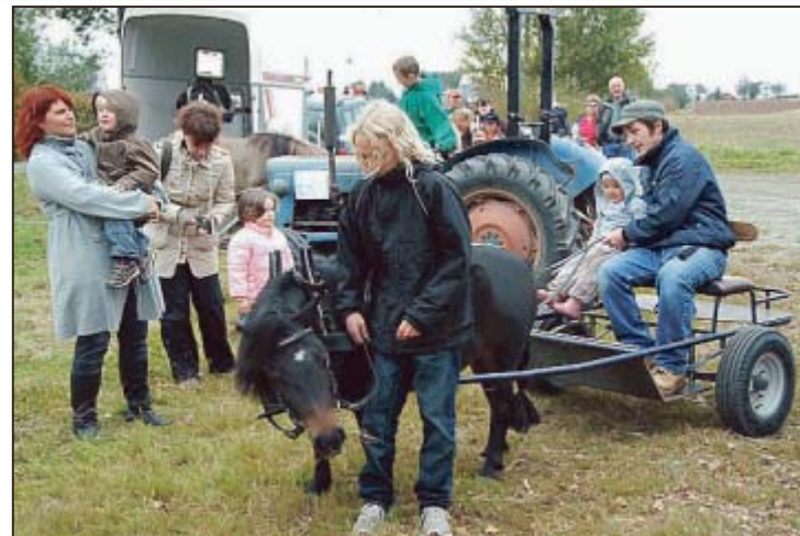
Kjøring med hest og kjerre var et populært innslag for de minste.