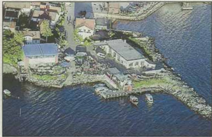
Planene for Norol-tomta i Drøbak er på ingen måte klare. Nå skal en arbeidsgruppe se på framtidens planer.